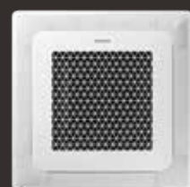
Wind-Free™ 4-vejs Kasette