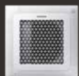
Wind-Free™ Mini 4-vejs Kasette